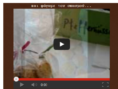
Εικόνα 2. Βίντεο με ήχο