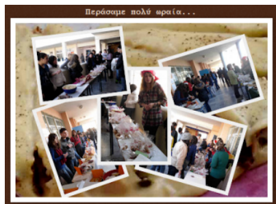
Εικόνα 1. Κολάζ φωτογραφιών