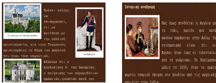
Εικόνα 3. Στιγμιότυπα από κείμενα με εικόνες