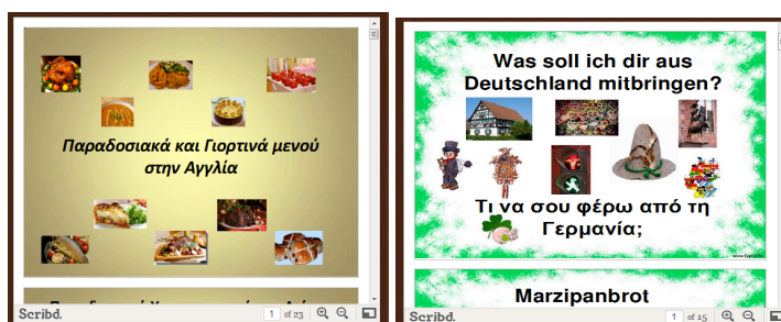
Εικόνα 4. Πρόγραμμα Scribd