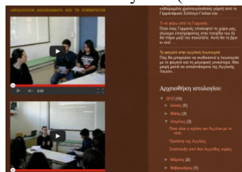
Εικόνα 6. Αποσπάσματα συνεντεύξεων

Καθ' όλη τη διάρκεια της ενασχόλησης τους με την εργασία, οι μαθητές χρησιμοποιούσαν επίσης τα προσωπικά τους ηλεκτρονικά ταχυδρομεία (e-mails) για